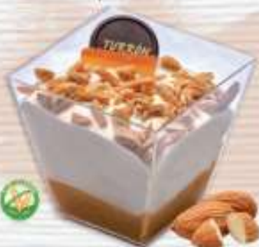
Copa Premium Turrón Suprema | Capacidad aprox.: 160 ml. Caja: 12 unidades.

Exquisita combinación de texturas y helados artesanos