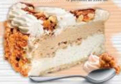
Tarta de Nata-Nueces | Helado de Nata, Helado de Nueces, Nata Merizada y Nueces picadas. Cantidad aprox.: 12 porciones de 2200 ml.